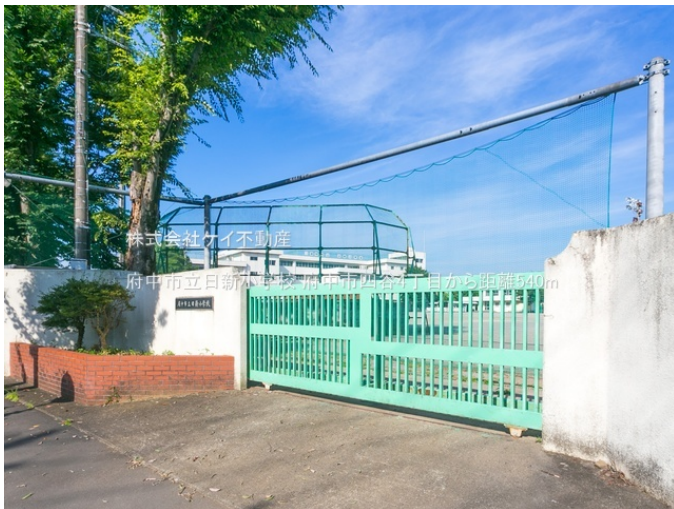
株式会社ケイ不動産