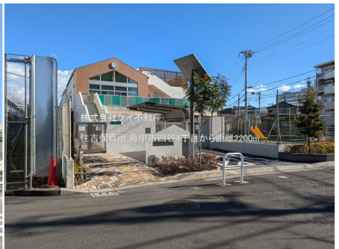
株式会社ケイ不動産