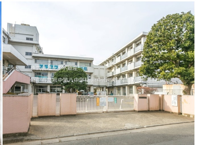
株式会社ケイ不動産