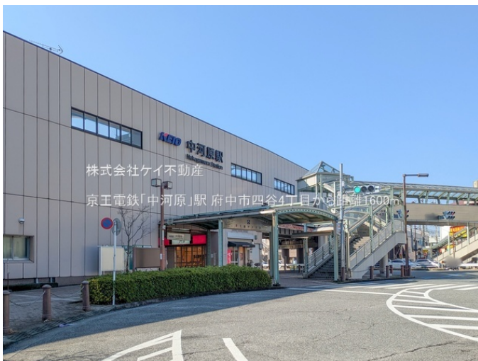
株式会社ケイ不動産