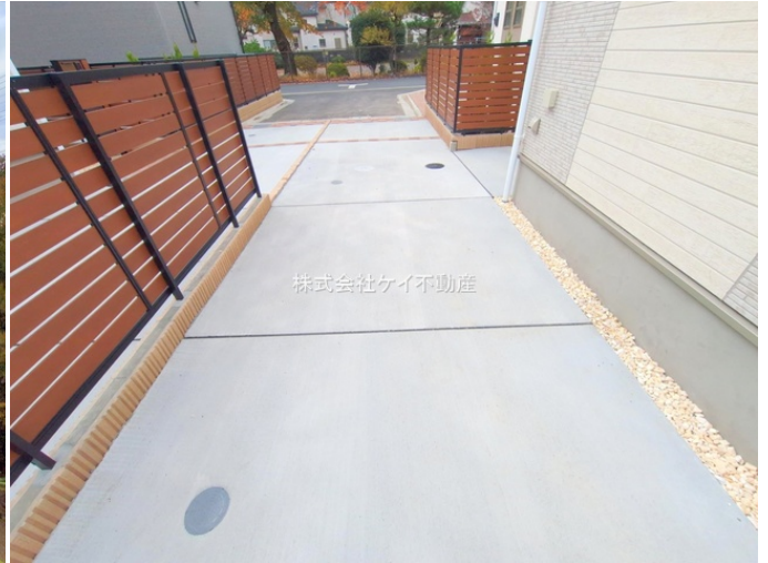
株式会社ケイ不動産