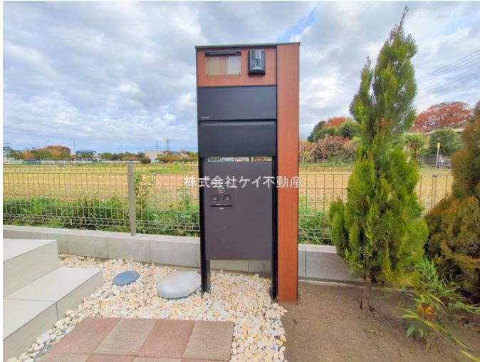
株式会社ケイ不動産