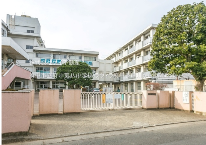
株式会社ケイ不動産 府中市立府中第八中学校 ラウイラ府中多摩川から距離280m