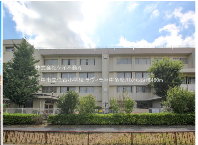
株式会社ケイ不動産 府中市立住吉小学校 ラウイラ府中多摩川から距離480m