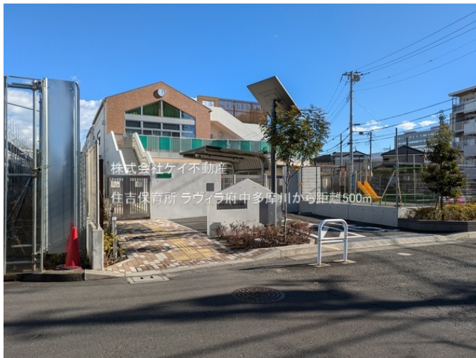
株式会社ケイ不動産 住吉保育所 ラウイラ府中多摩川から距離500m