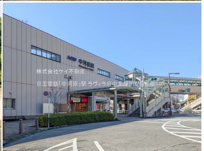
株式会社ケイ不動産 京王電鉄「中河原」駅 ラウイラ府中多摩川から距離640m