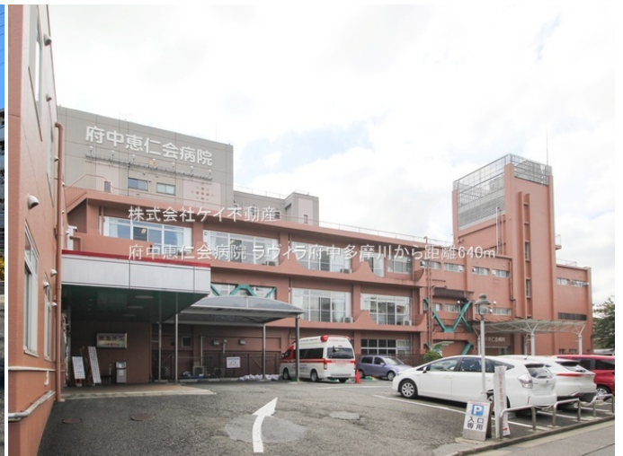
株式会社ケイ不動産 府中恵仁会病院 ラウイラ府中多摩川から距離640m