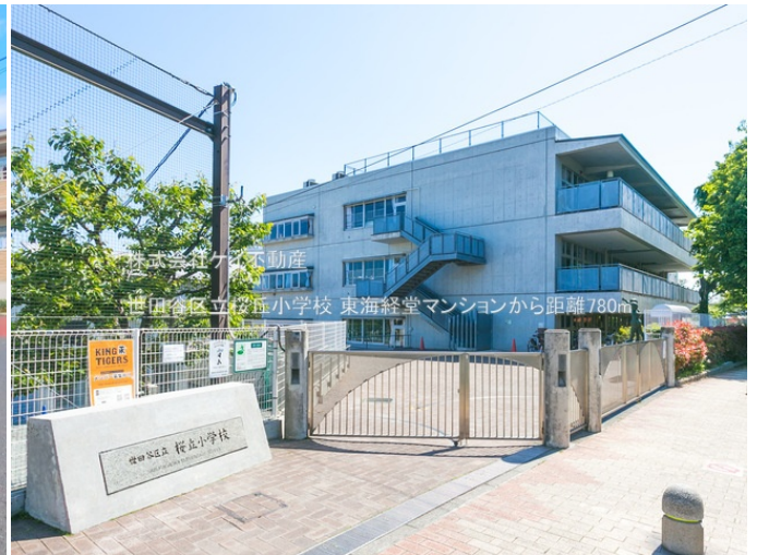
株式会社ケイ不動産 世田谷区立経堂小学校 東海経堂マンションから距離780m