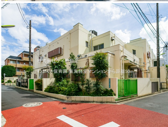
株式会社ケイ不動産 わが家は保育園 東海経堂マンションから距離50m