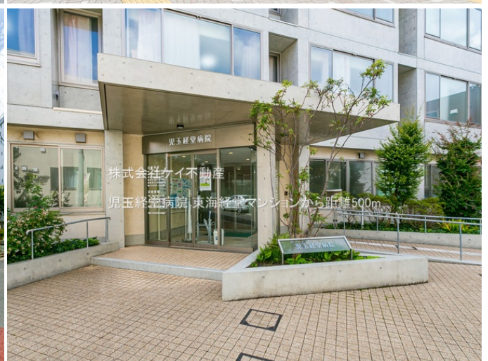
株式会社ケイ不動産 児玉経堂病院 東海経堂マンションから距離500m