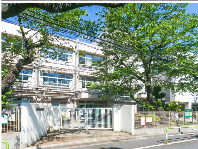
株式会社ケイ不動産 世田谷区立経堂小学校 東海経堂マンションから距離980m