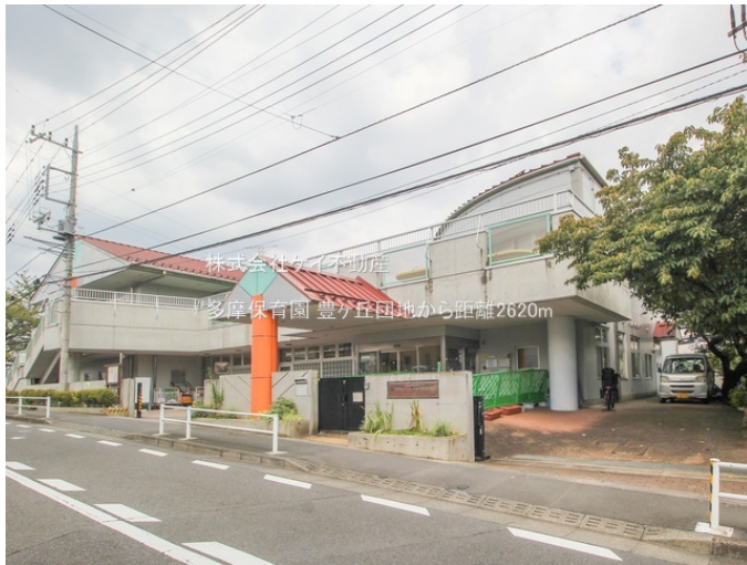
株式会社ケイ不動産 多摩保育園 豊ヶ丘団地から距離2620m