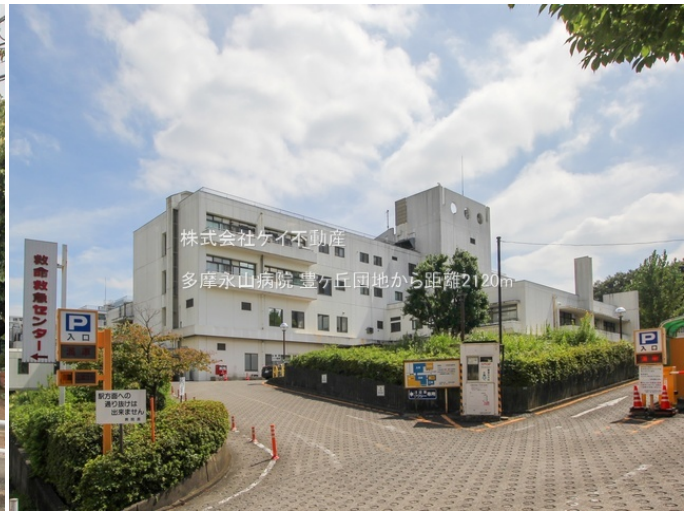
株式会社ケイ不動産 多摩永山病院 豊ヶ丘団地から距離2120m

連絡先 042-314-6661 9:00～18:00 水曜定休 http://www.kei-fudousan.com/bukken?id=3015